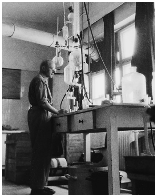
Ein KZ-Häftling in der Dachauer „Kräuterplantage“, wahrscheinlich im dortigen Forschungsinstitut für Heilpflanzenbau und Ernährungskunde. Heinrich Himmler (Diplom-Landwirt an der TH München 1922) hatte die Plantage 1938 errichtet. Einzelne THM-Hochschullehrer berieten bzw. unterhielten Forschungs Kooperationen mit der SS.